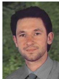
HP Reiko Wollenzin Seminar für BICOM – Multisoft